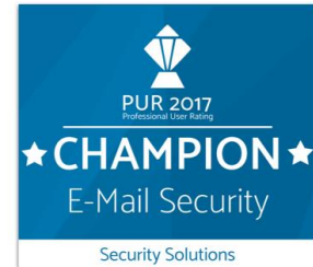
NoSpamProxy siegt in der Kundenbewertung

Paderborn, 26. Januar 2017 – Net at Work GmbH, der Hersteller der modularen Secure-Mail-Gateway-Lösung NoSpamProxy aus Paderborn, gibt bekannt, dass die Mail-Security-Lösung als Champion aus dem Professional User Rating Security Solutions 2017 (PUR-S 2017) des Analystenhauses techconsult hervorgeht. Das Paderborner Softwarehaus setzte sich damit gegen viele relevante Anbieter für E-Mail-Security durch. Basis für die unabhängige und herstellerneutrale Bewertung ist das umfassende Feedback aktiver Kunden und Nutzer.